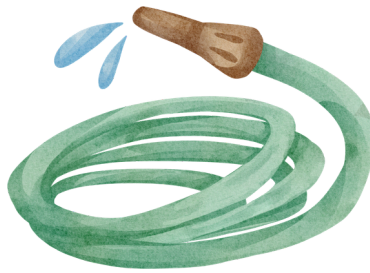
Un tuyau .....