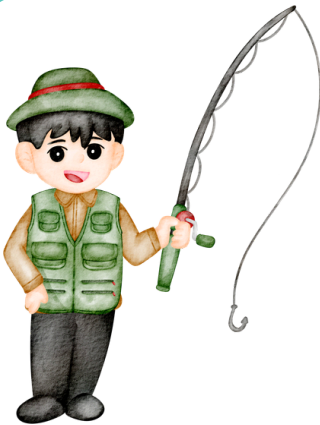
Un pêcheur .....