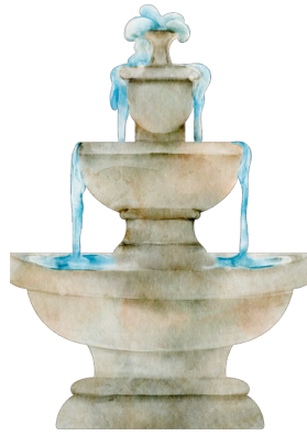
Une fontaine .....