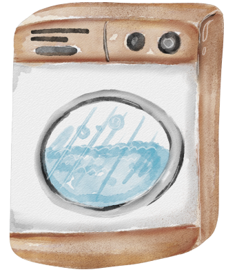
Une machine à laver .....