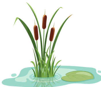
Un roseau .....