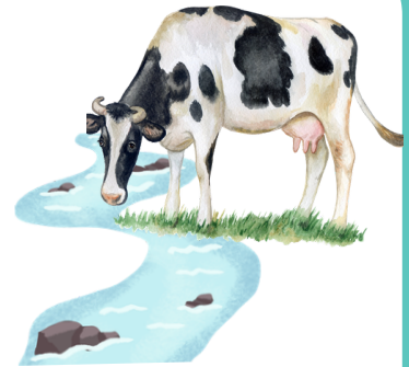
Une vache qui boit .....