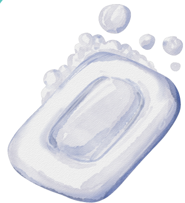
Un savon .....