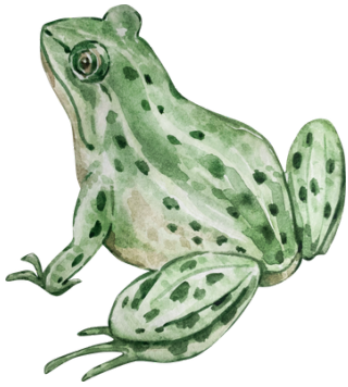
Une grenouille .....

Comment dit-on en patois ? Demande autour de toi !